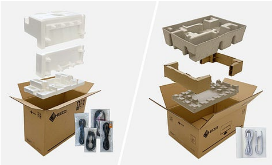
Konventionelle Verpackung vs. umweltfreundliche Materialien

Ebenso durchdacht ist das Verpackungsdesign des EV2490. Der nach den Nachhaltigkeitsstandards TCO Certified Generation 9, EPEAT und Energy Star zertifizierte Monitor ist nämlich das erste Produkt der FlexScan-Reihe, bei dessen Verpackung sich EIZO von Plastik und Polystyrol verabschiedet. Stattdessen ist der Monitor sicher mit geformtem Zellstoff verpackt, der aus recyceltem Karton und Zeitungspapier hergestellt wird. Die beigelegten Kabel stecken in Zellstofftüchern statt in Plastiktüten.